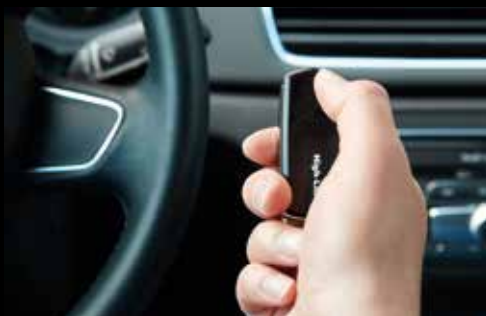
High-Line handzender 4-kanaals 868 Mhz

Hoge kwaliteit, bewezen technologie en betrouwbare werking, gecombineerd met een passend onderhoudscontract staan borg voor een lange levensduur van uw deur.