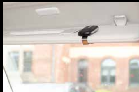
High-Line car kit adapter set Zonneklep clip