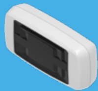
High-Line myQ internet interface 'Gateway'