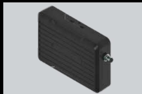
High-Line externe ontvanger 3-kanaals 433-868 Mhz