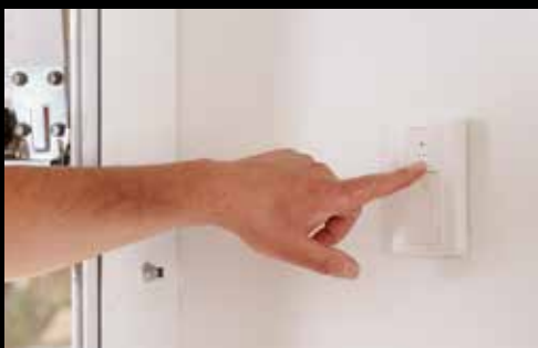
High-Line draadloze wandschakelaar 2-kanaals 868 Mhz