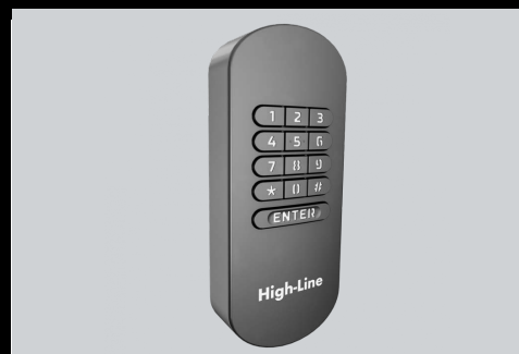
High-Line codeschakelaar 3-kanaals IP55 (model 2022)